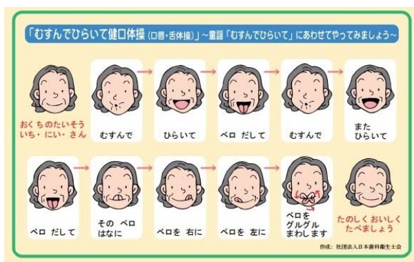
教室で使用した資料の一部

口腔ケアはその中で3回あり、当院の歯科衛生士が担当しています。 3回の教室では、簡単な口腔内チェックから始まり、口腔ケアの大切さや誤嚥性肺炎についての講話をしたり、歯や義歯の磨き方や、飲み込みをよくするための、お口の体操や運動などをお話しています。